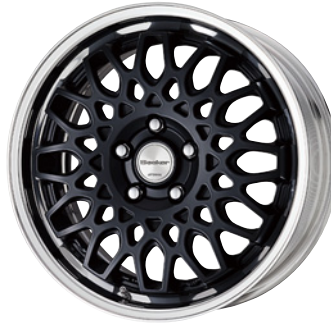
マットブラック・MBL