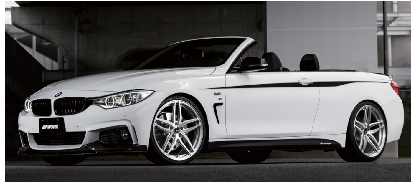
[SIZE] FRONT : 20inch × 9.0J INSET 25mm TIRE : 245/30-20 REAR : 20inch × 10.0J INSET 40mm TIRE : 275/30-20 COLOR : ブラッシュド (BRU)

表示価格は全て税抜き価格です。●カラー:ペイント/ブラックアノダイズド(SKA/B)/ブラッシュド(BRU) ※ペイントカラーは、WORK指定のカラーよりお選びいただけます。詳しくはお問合せ下さい。 ●付属品:センターキャップ(クロムメッキ)1個・エアバルブ1個(V29A2) ●◆は5H-120の設定がありません。 ※P.C.D.5H-100モデルは、小径レンヂ仕様となりますので詳しくはお問合せ下さい。 ※ご使用になるナット、ボルトに関してはお問合せ下さい。 ※製造条件により対応できない場合があります。 ※オーダーインセットは車両条件により対応できない場合があります。 ※仕様により多少納期がかかる場合があります。 ※ブラックアノダイズド(SKA/B)は、製造上色むら・個体毎の色差が生じる場合があります。これらの色むら・色差は製品保証外となりますのでご注意ください。 ※ハブ高さクリアランスの数値は、取付面からセンターキャップまでの参考値です。上記のハブ高さ以下であっても車両ハブ形状によっては接触する場合があります。 ※19inchについてはお問い合わせ下さい。 Optional Items ■センターキャップ (カットクリア) 同価格 ■センターキャップ (グレークリア) 同価格 ■Kset (ブラックエアバルブ) 同価格 ■ハブカラー 5H-100(60)用: トヨタ、マツダ (φ54)・ホンダ、ミツビシ、スバル (φ56) VW (φ57) 各¥1,500/1set (2個) 5H-114.3用: トヨタ (φ60)・ニッサン (φ66)・ホンダ (φ64) ミツビシ、マツダ (φ67) 各¥1,500/1set (2個) スバル (φ56) ¥1,500/1set (2個) 5H-112用: AUDI&VW (φ66.5からφ57) ¥1,500/1set (2個) 5H-120用: LEXUS LS (φ72.5からφ60) ¥1,500/1set (2個) HONDA LEGEND (φ72.5からφ64) ¥1,500/1set (2個) Repair Parts ■№120239 センターキャップ ¥7,000/1個 (クロムメッキ) ■№120240 センターキャップ ¥7,000/1個 (カットクリア) ■№120241 センターキャップ ¥7,000/1個 (グレークリア) ■№180063 エアバルブ ¥1,500/1個 (V29A2) ■№180085 ブラックエアバルブ ¥1,500/1個 (V29K2)