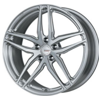
ブラッシュド (BRU) (ミドルコンケイブ) 20 FORGED