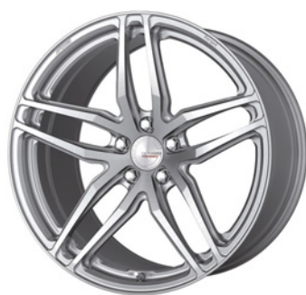
ブラッシュド (BRU) (ウルトラディープコンケイブ) 20 FORGED