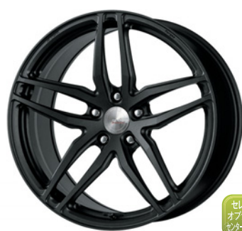
ブラックアノダイズド (SKA/B) (ディープコンケイブ) Kset仕様 20 FORGED