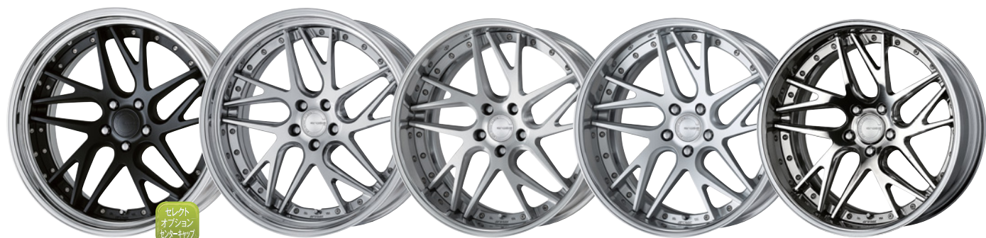
マットブラック (MBL) (ディープコンケイブ) STEP RIM 21, コンボジットハブブラッシュド (P8U) (ミドルコンケイブ) STEP RIM 21, ブラッシュド (BRU) (ミドルコンケイブ) 20, マットシルバー (MSL) (ディープコンケイブ) 20, ハーフフィニッシュ (PP2) (ディープコンケイブ) 20

開発中の為、仕様を予告無く変更する場合があります。 ※ 21inch STEP RIM / 20inch 除く