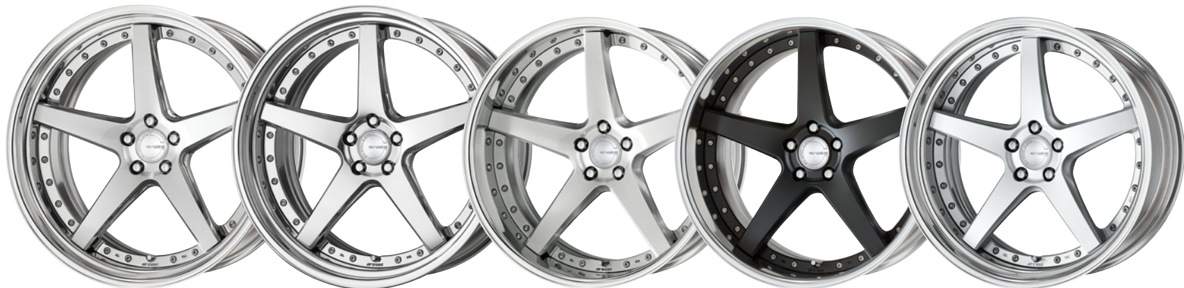
コンビジットパフブラッシュド・PBU SR 22 (ディープコンケイブ)