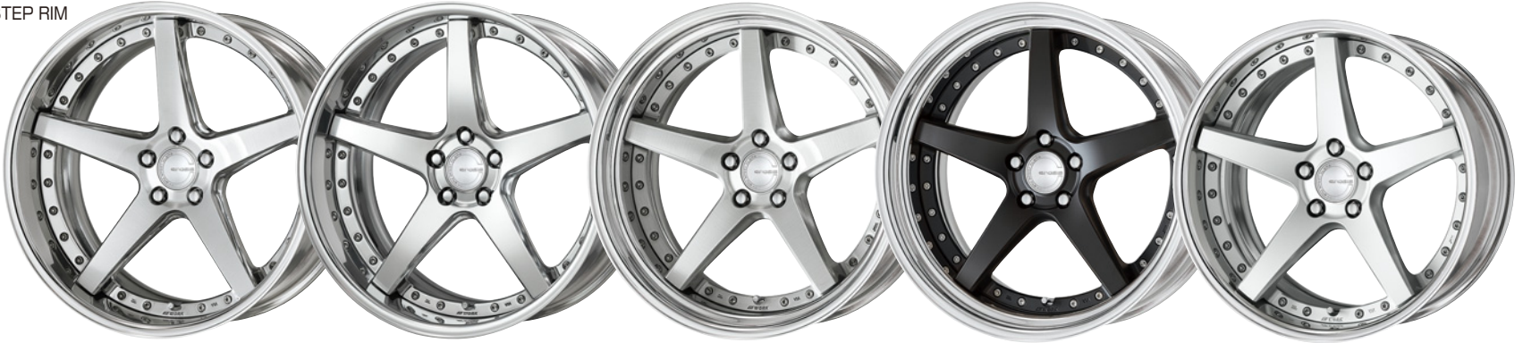
コンボジットバフブラッシュド・PBU 20 (ディープコンケイブ)