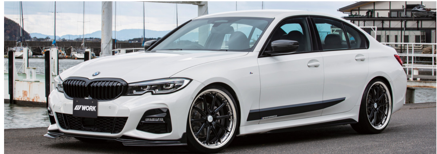
*装着画像はイメージです。