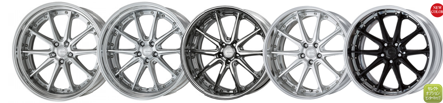
ブラッシュド SR 21 コンポジットパフブラッシュド SR 21 (オプションカラー) パフフィニッシュ 20 (オプションカラー) マットシルバー 20 ブラック/アウトサイドポリッシュ 20