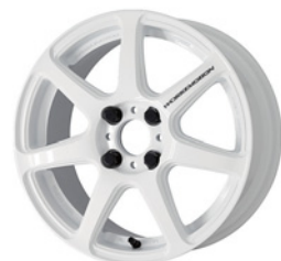
ホワイト (WHT) 15