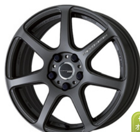
マットカーボン (MGM) (セミテーパー) (FLAT TYPE ブラックキャップ) 17