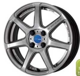
グリミットシルバー (GTS) 16 (FLAT TYPE ブルーキャップ)