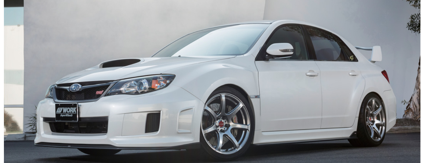
[SIZE] FRONT : 18inch × 9.5J INSET 38mm(DT) TIRE : 255/35-18 REAR : 18inch × 9.5J INSET 38mm(DT) TIRE : 255/35-18 COLOR : グリミットシルバー (GTS)