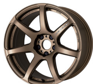
アッシュドチタン (AHG) 18 (ディーテーパー)

*カラリスム・カラリスムクリア対応アイコンの詳細は各ブランドの最終ページをご確認ください。