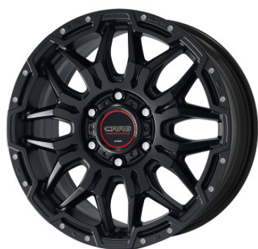
マットブラックピアスマシニング・MBLPM

※標準P.C.D. 6H-139.7は 取付ボルトM14対応です (座面は60°テーパードとなります)