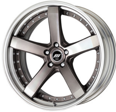
トランスグレーポリッシュ・TGP SR 20 (ミドルコンケイブ)