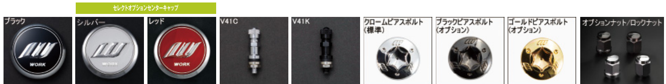
※ナットの詳細について▶P.262