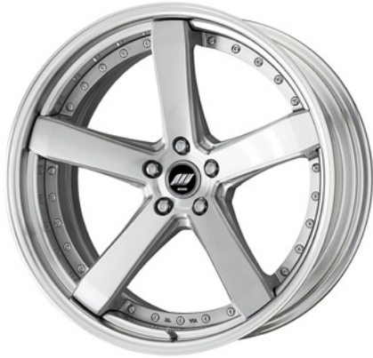
ブラッシュド・BRU SR 21 (ディープコンケイブ)