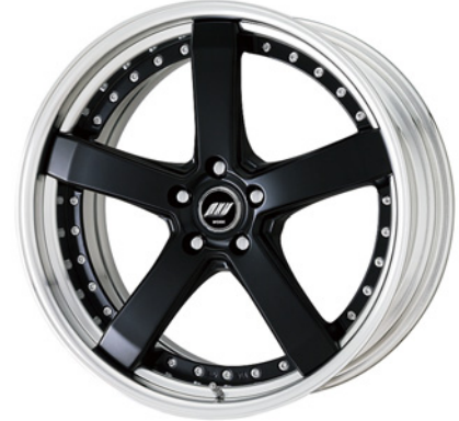
マットブラック・MBL SR 20 (セミコンケイブ)